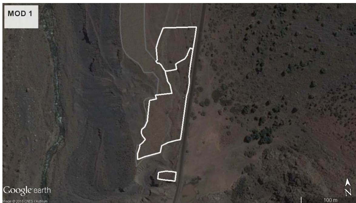
Figura 2. Superficie definitiva considerada para el MOD 1.