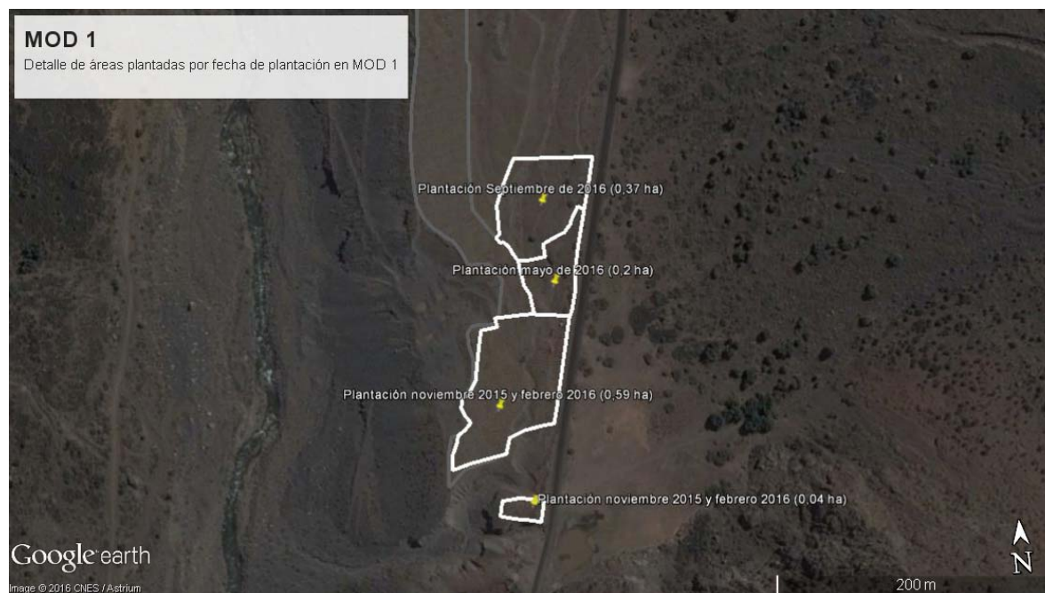
Figura 3. MOD 2 y superficies plantadas en meses correspondientes.