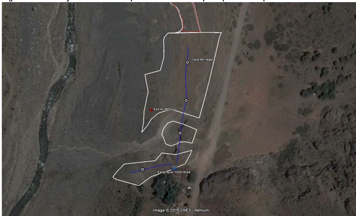
Fig 1. Ubicación y forma de la superficie de MOD 1 para plantación presentada a la autoridad.